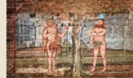
Figurálne motívy Adama a Evy v raji, nástenná maľba z roku 1665 – Hervartov.

zo systému rámov, vzpier a zavetrení. Zrubové konštrukcie často oplášťovali vertikálne kladeným doštením, ktoré zároveň využívali pri úprave povrchov v interiéroch ako podklad pre nástenné maľby. Najstaršie zo zachovaných objektov pochádzajú z 15. storočia, väčšina je však až z 18. storočia.