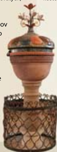
Kamenná krstiteľnica z roku 1690 – Kežmarok.

Osem autentických drevených kostolov a chrámov bolo v roku 2008 zapísaných do Zoznamu svetového dedičstva UNESCO pod názvom Drevené chrámy v slovenskej časti karpatského oblúka. Aj keď patria k trom rôznym konfesiam, spájajú ich niektoré spoločné črty. Najmarkantnejšou je ich konštrukcia, v ktorej sa temer bez výnimky dominantne uplatňuje starodávna technika zrubu. Len zriedka, najmä pri stavbe veží, stavitelia využili stĺpikovú konštrukciu. Pri stavbe niektorých evanjelických chrámov sa ojedinele uplatnila aj hrazdená technika, kde doskové výplne stien nesie konštrukcia zložená