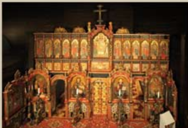
Ikonostas z polovice 18. storočia – Ladomirová.

Východnú skupinu budovanú v súvislosti s procesom znovuzjednocovania časti východných kresťanov s katolíckym Rímom od konca 16. storočia predstavujú cerkvi z obdobia 17. až 18. storočia. Cerkvi si vo svojej architektúre uchovali základné znaky vychádzajúce z byzantských a neskôr z kyjevskoruských vzorov s trojdielnou dispozíciou. Každý zrub má samostatnú strechu s vežovitým ukončením, ktoré graduje k dominujúcej západnej veži nad vstupom. Najvýznamnejším a umelecky najhodnotnejším mobiliárom gréckokatolíckych kostolov je ikonostas, vysoká, bohato vyrezávaná maľovaná a zlátená stena siahajúca po strop lode. Tvoria ju ikony usporiadané podľa liturgicky predpísaného kánonu. V zozname svetového dedičstva sú zapísané cerkvi v Ruskej Bystrej, v Ladomirovej a Bodružale.