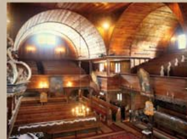
Drevená stĺpová architektúra a valená dosková klenba – Hronsek.

Najstaršie sú rímskokatolícke kostoly z konca 15. a zo začiatku 16. storočia. Sú postavené v duchu doznievajúcej gotiky, s vysokými šindľovými strechami. Ich vnútorný