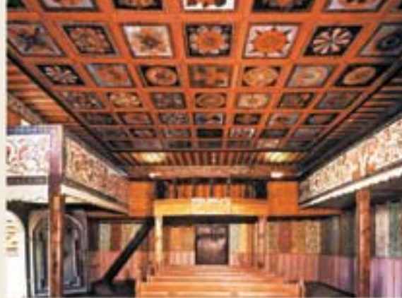
Bohato zdobený kazetový strop chrámovej lode – Tvrdošín.

Rustikálne pôsobiace drevené kostoly a chrámy sú dnes už len zvyškom z pôvodného množstva približne tristo objektov rozosiatych po území Slovenska. Ich krehká a viditeľne zraniteľná krása je nositeľom jedinečnej symbiózy kresťanskej viery a ľudovej architektúry. Neprofesionálni majstri uplatňujúci generáciami získanú dôvernú znalosť základného stavebného materiálu, dreva, ich stvárnilo do mnohorakej podoby. Konečný vzhľad stavieb ovplyvnili požiadavky vyplývajúce z rôznych náboženských obradov a kultúrnych princípov, ale aj z osobitostí regiónov a oficiálneho vkusu. Väčšinou osamotene stojace stavby často korunujú vyvýšeniny a návršia.