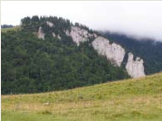
Ťavia skála – bralo medzi bočnými dolinami Malé a Velké Studienky