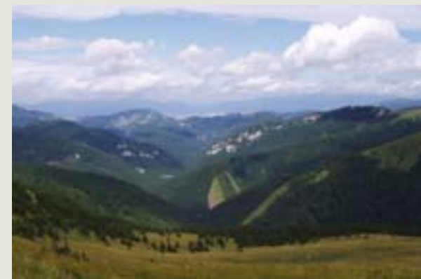
Pohľad na Gaderskú dolinu

Medzi najobľúbenejšie turistické lokality patrí Gaderská a Blatnická dolina, najvyššie bralá Turčianskej kotliny Tlstá a Ostrá, hlavný hrebeň v oblasti Krížnej, Ostredka a Borišova, Blatnický a Sklabinský hrad a rezervácia ľudovej architektúry osada Vlkolínec, jedinečná lokalita zapísaná do zoznamu svetového dedičstva UNESCO.