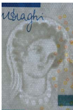
Obrázok 3 Portrét Európy (vodoznak)