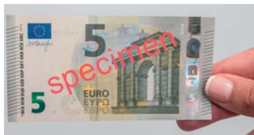
Obrázok 19 Overenie naklonením