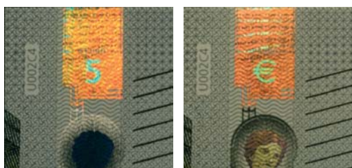
Obrázok 21 a 22