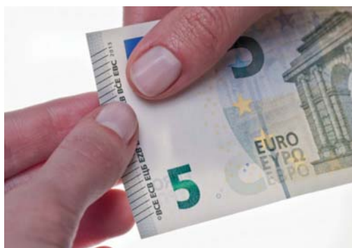
Obrázok 7 Vystupujúce krátke linky

Pri overovaní bankovky 5 € novej série hmatom overujeme viacero „hmatových“ vlastností eurobankovky.