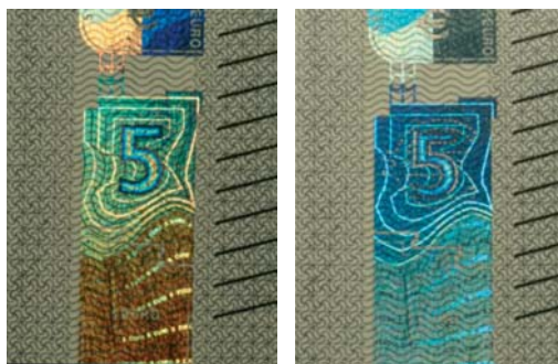
Obrázok 25 a) a 25 b)