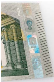
Obrázok 20 Holografický prúžok