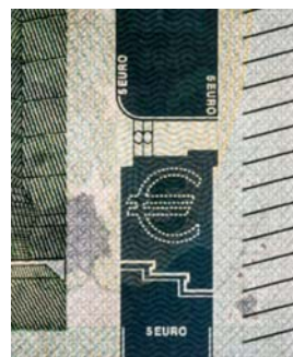
Obrázok 17 Hologram

Ochranný prúžok v priehľade proti svetlu vyzerá ako tmavá čiara (obr. č. 15). V prúžku je bielym mikropísmom uvedený znak € a hodnota bankovky (obr. č. 16).