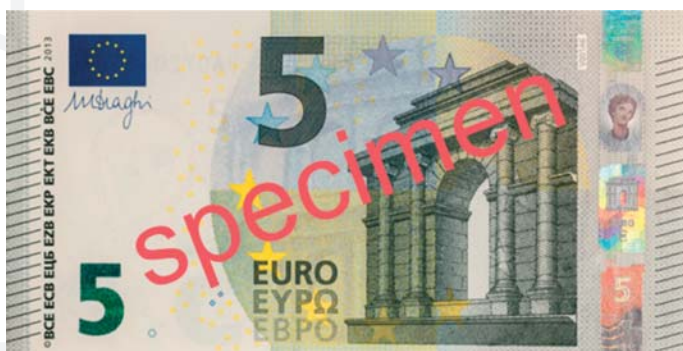
Obrázok 1 Lícna strana bankovky

Eurobankovky druhej série obsahujú zdokonalené ochranné prvky, ktoré vychádzajú z najnovších poznatkov v oblasti ochrany platidiel a technológie výroby bankoviek. Nové ochranné prvky série Európa sa dajú na bankovkách ľahko identifikovať, zohľadňujú najnovší vývoj v oblasti technológií