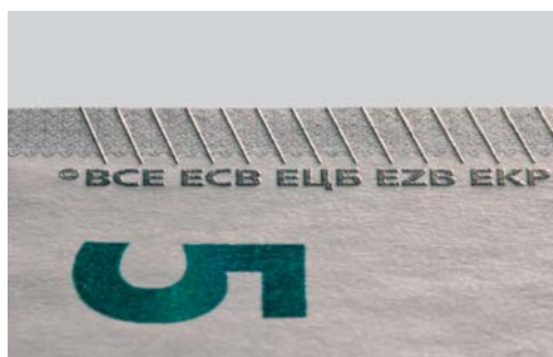
Obrázok 11 Hĺbkotlač detail