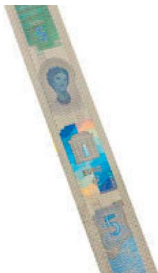
Obrázok 4 Portrét Európy (hologram)

reprodukcie obrazu a zabezpečujú odolnosť bankoviek proti falšovaniu aj do budúcnosti.