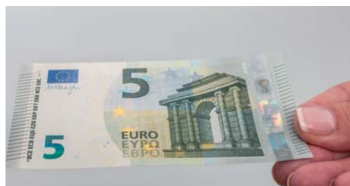
Obrázok 18 Overenie naklonením