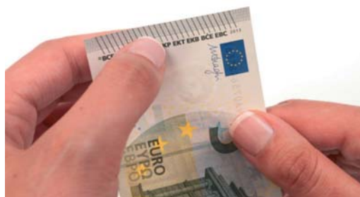
Obrázok 10 Skratky názvu ECB