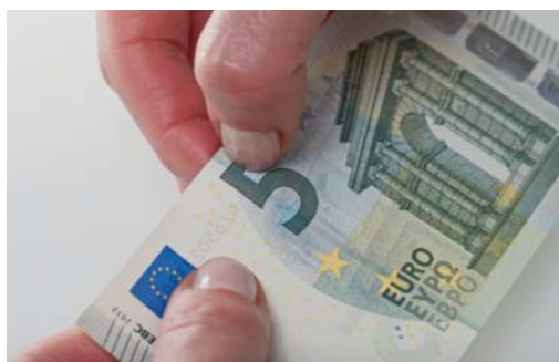
Obrázok 9 Veľké hodnotové číslo