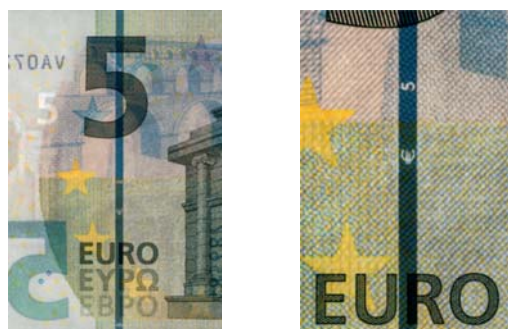
Obrázok 15 a 16 Ochranný prúžok

Rovnako ako eurobankovky prvej série, aj eurobankovky druhej série budú vytlačené na bankovkovom papieri vyrobenom z bavlny, ktorý je pevný a pružný (obr. č. 5 a č. 6).