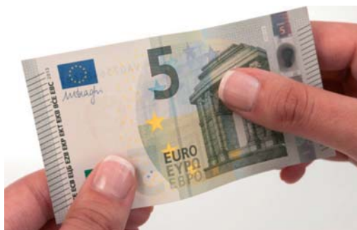
Obrázok 8 Hlavný obrazec