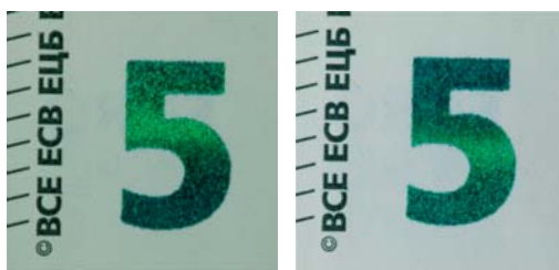
Obrázok 26 a 27