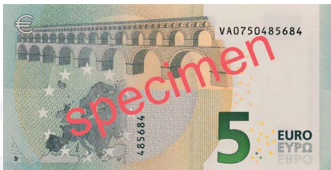
Obrázok 2 Rubová strana bankovky