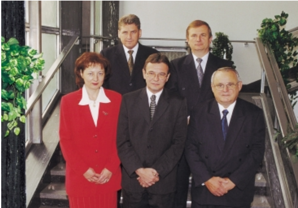
Členovia Bankovej rady NBS