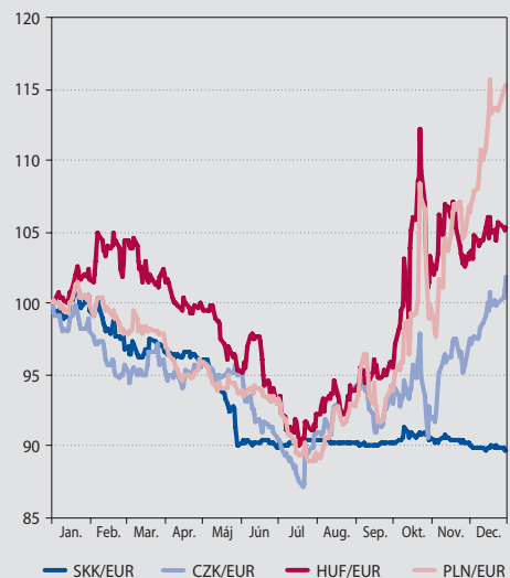
Graf 47 Vývoj výmenných kurzov krajín V4 v roku 2008 (index)

V súvislosti s pribúdajúcimi skúsenosťami a poznatkami o prebiehajúcich prípravách došlo k dvom aktualizáciám Národného plánu zavedenia eura. S cieľom hladkého a jednoduchého predzásobenia obyvateľov, ako aj drobných podnikateľov a živnostníkov eurovou hotovosťou, bol pri aprílovej aktualizácii Národný plán zavedenia eura doplnený o rozhodnutie vyrobiť a distribuovať tzv. štartovacie balíčky eurových mincí. V septembri 2008 bola schválená tretia a posled-