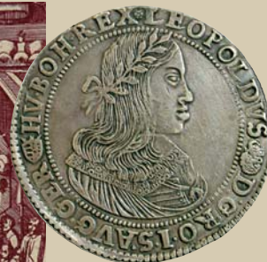
Kremnický toliar Leopolda I.