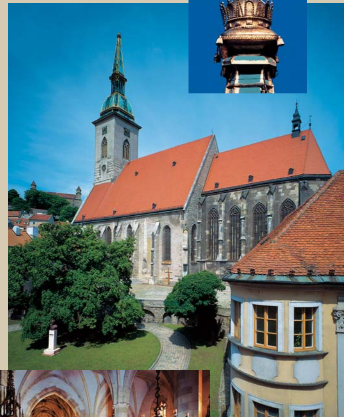
Dóm sv. Martina