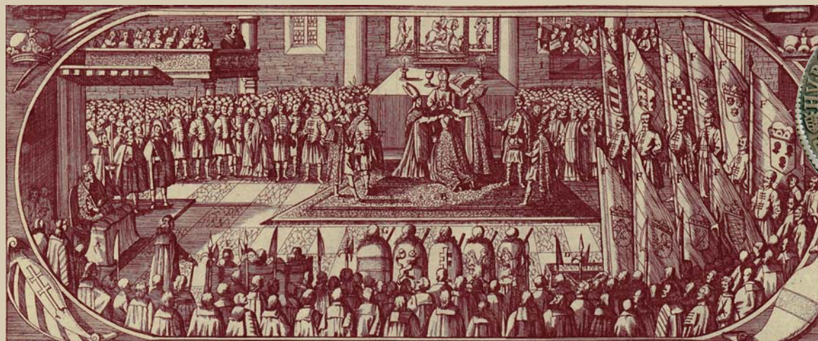
A. Ihre Röm. Kay. Majest. B. Ihre Königl. May. vorin Altar kniet. C. Des Königreichs Hungaren Cron Aufz. Größe und Schertz. D. Ihre Königl. May. Thron. E. Hertzog. Njancius Baisjt. Feij. sampt anderen Hertzog. Bottschafften. F. Ders Königreich in Italienia und Pheben. G. Der Röm. Kay. Köng. Reichs. auch Vng. Röm. Ötzter. Hertzog. H. Ihre Königl. May. als Für. Kaiserin. sampt dem Fräulein Maria. I. Ihre Königl. May. Miltic. K. Das Königliche Stofel. L. Wie Ihre Königl. May. den. Stenuden den Aigt. präficiert. M. Wie Ihr Königl. May. auf dem Berg mit St. Stephans Schwert. N. Wie Ihre Königl. May. den.

ulicami mesta do kostola Panny Márie pri kláštore františkánov, kde pasoval vybraných šľachticov za rytierov Zlatej ostrohy. Potom sa kráľ na koni odobral za opevnenie mesta, kde zložil prísahu, ktorú mu predčítal arcibiskup. Ďalší akt korunovačnej slávnosti sa odohrával pri Dunaji, kde bol navŕšený kopček zeminy, privezenej zo všetkých oblastí kráľovstva. Kráľ na koni zamával vytaseným mečom na všetky svetové strany, čím naznačil, že je pripravený brániť kráľovstvo pred nepriateľmi zo všetkých strán. Po ceremóniáli nasledovala slávnostná hostina.