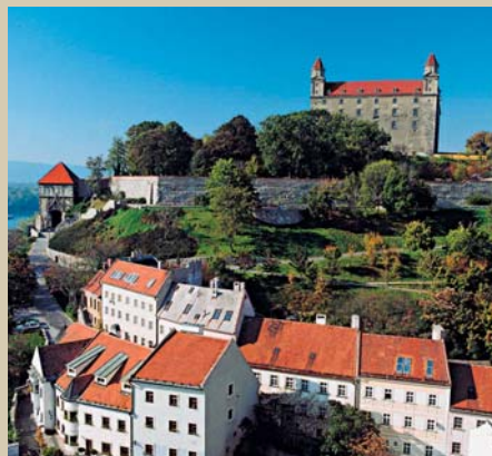
Bratislavský kráľovský hrad

Dnešné Slovensko bolo od 10. storočia až do konca prvej svetovej vojny súčasťou uhorského kráľovstva. V prvej tretine 16. storočia ohrozovali Uhorsko pustošivé nájazdy Turkov, ktorí v roku 1526 v bitke pri Moháči porazili kresťanskú armádu. Uhorský a český kráľ Ľudovít II. v tejto bitke zahynul. Turkom sa otvorila cesta do uhorskej nížiny a rýchlo postupovali dovnútra krajiny. Po obsadení hlavného mesta Budína hľadala uhorská šľachta, svetskí aj cirkevní hodnostári nové útočisko. Výhodná poloha a pevné opevnenie Bratislavy vytvárali vhodné predpoklady