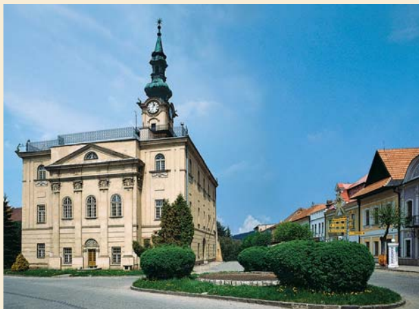
Kežmarok, sídlo významného evanjelického lýcea

V 50. rokoch, keď sa štúrovská generácia utiahla z verejného života a neboli takmer nijaké možnosti na literárnu a kultúrnu aktivitu, ťažisko Kuzmányho práce spočívalo v teologickej oblasti. Svoje univerzitné prednášky zhrnul do trojväzbového diela v nemčine Praktische Theologie (Praktická teológia). Literárnej tvorbe sa venoval až do svojej smrti. Zomrel 14. augusta 1866 v Turčianskych Tepliciach, pochovaný je na Národnom cintoríne v Martine.