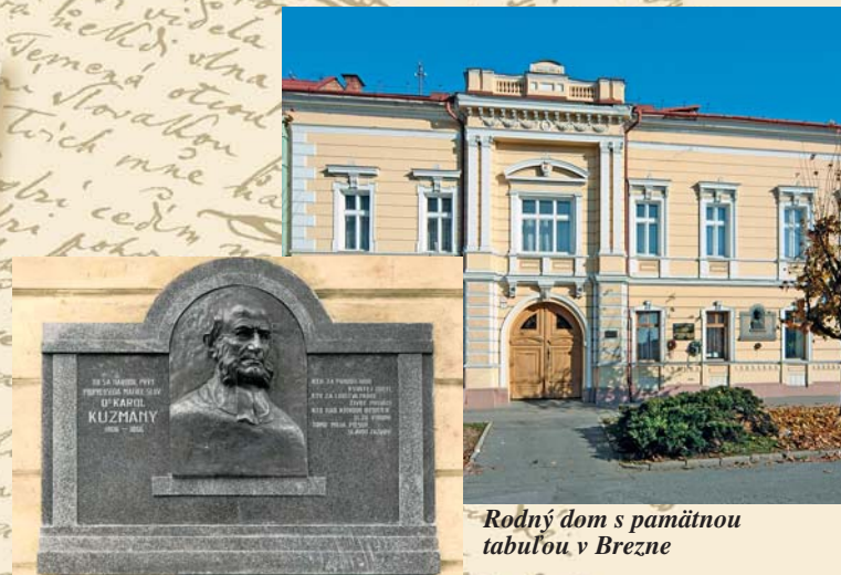
Rodný dom s pamätnou tabuľou v Brezne