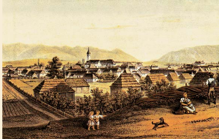
Turčiansky Sv. Martin v polovici 19. storočia

od roku 1829 ako profesor na evanjelickom lýceu v Kežmarku, neskôr ako farár vo Zvolene a Banskej Bystrici. V rokoch 1849 – 1860 prednášal na evanjelickej teologickej fakulte vo Viedni. Neskôr pôsobil ako patentálny superintendent v Banskej Bystrici a od roku 1863 v Martine, kde bol zároveň farárom i úradujúcim podpredsedom Matice slovenskej, celonárodnej kultúrnej inštitúcie Slovákov.