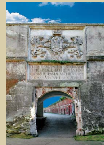
Ferdinandova brána Starej pevnosti