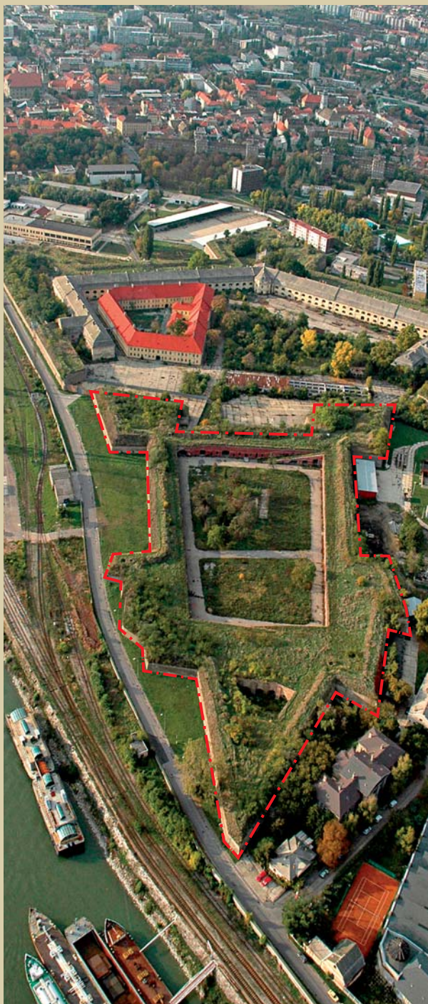
Stará pevnosť na sútoku Dunaja a Váhu