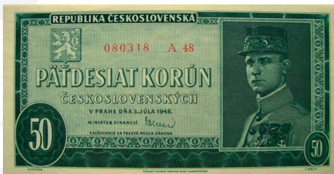
50 korún československých z roku 1948.