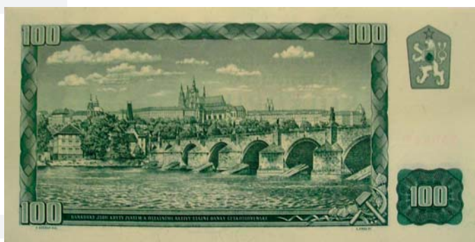
100 korún z roku 1961, predná a zadná strana, tzv. Zelené Hradčany