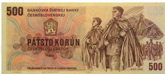
500 korún z roku 1973.