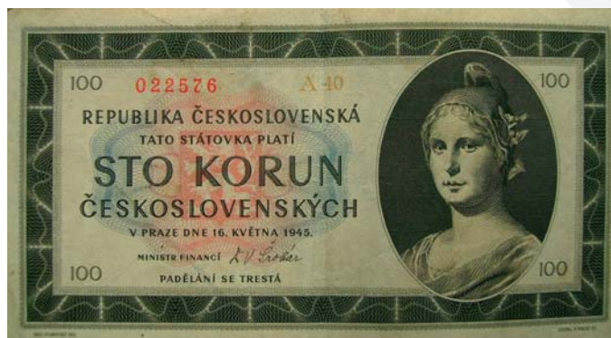
100 korunová štátovka z roku 1945.

Ekonomike sa naďalej nedarilo, pričom sa stále viac hovorilo o potrebe systémovej zmeny v peňažných vzťahoch a tým aj v menových pomeroch. V tom čase išlo o snahu dostať československé peňažníctvo do pozície centrálneho, teda direktívneho riadenia a o vytvorenie nového systému riadenia peňažného obehu. Situácia vyústila dňa 30. 5. 1953 do menovej reformy. V rámci tejto reformy boli z československého územia stiahnuté platidlá v úhrnej hodnote 52,1 mld. Kčs, pričom boli vymenené za nové peniaze (vytlačené v Sovietskom zväze), no vo výrazne redukovanom pomere. Staré hotovostné peniaze v sume do 300 Kčs nových peňazí boli vymieňané tým občanom, ktorí nikoho nezamestnávali, v pomere 5 : 1. Ešte