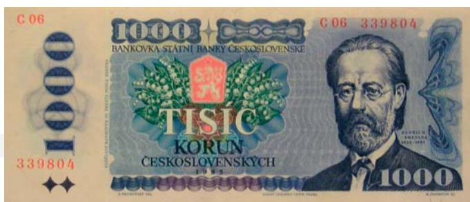
1000 korún z roku 1985.

HDP zaznamenal pokles 6,6 %). Vývoj hospodárstva i meny už však v rokoch 1991 a 1992 ovplyvňovali diskusie politikov o osude spoločného štátu Čechov a Slovákov.