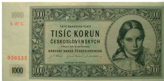
1000 korunová bankovka z roku 1945.