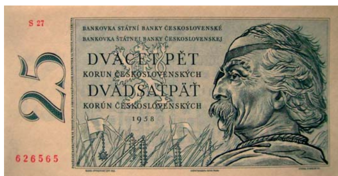
25 korunová bankovka z roku 1958.

tívne stabilizovala, pričom bolo vidieť aj znaky jej oživenia. Napriek značnej snahe došlo v tomto roku k zníženiu tvorby HDP o 0,3 % (v roku 1991