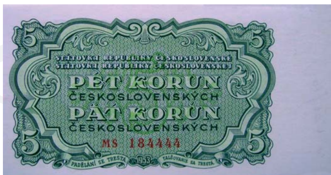
Päťkorunová štátovka z roku 1953.

nevýhodnejšie bola vymieňaná hotovosť zamestnávateľom a to v pomere 50 : 1. V rovnakom pomere 50 : 1 boli prepočítavané aj všetky vklady nad 50 tisíc korún. Štátne cenné papiere boli zrušené, rovnako poisťky a viazané vklady z menovej reformy z roku 1945 boli anulované (v sume 80 mld. Kčs). Výška obeživa sa výrazne znížila a koncom roka 1953 predstavovala len 3,8 mld. Kčs, na stave úsporných vkladov bola suma 3,4 mld. Kčs.