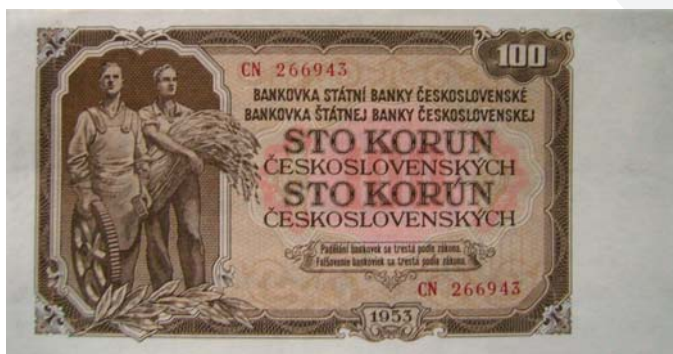
100 korún československých z roku 1953.

V roku 1989 bol vydaný zákon o Štátnej banke československej, čo ŠBČS dávalo kompetenciu emisnej banky s možnosťou vykonávať samostatnú menovú politiku. Zaviedol sa jednotný kurz koruny. V roku 1990 došlo k zníženiu kúpnej sily koruny a k oslabeniu meny. Koruna bola devalvovaná, a to o 18,6 % voči konvertibilným menám. Súčasne však bola koruna revalvovaná voči prevoditeľnému rublu o 10 %. V roku 1990 bola koruna redukovaná voči americkému doláru o viac ako 50 %. Kurz koruny bol v závere roka ešte raz devalvovaný na 28 Kčs za 1 USD. Devalvovanie kurzu koruny voči doláru v roku 1990 spolu o 80 % sledovalo cieľ zaviesť vnútornú vymeniteľnosť koruny, čiže vnútornú konvertibilitu meny. ŠBČS sa v roku 1990 rozhodla vykonávať reštriktívnu menovú politiku, pričom hlavným cieľom bolo nedopustiť vznik inflačnej špirály. V roku 1992 sa československá ekonomika rela-