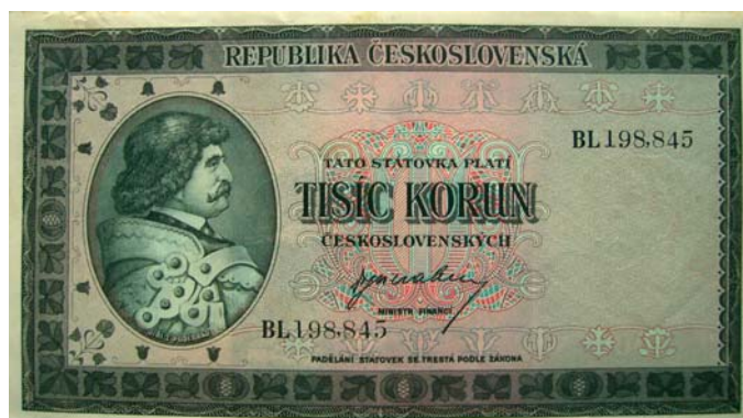
1000 korunová štátovka, tzv. Londýnske vydanie.