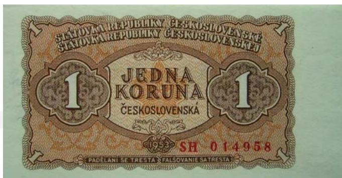
Jednokorunová štátovka z roku 1953.