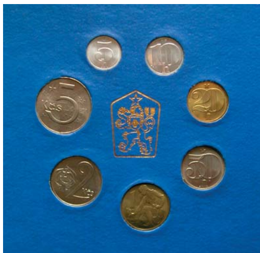
Súbor československých obehových mincí z roku 1986.