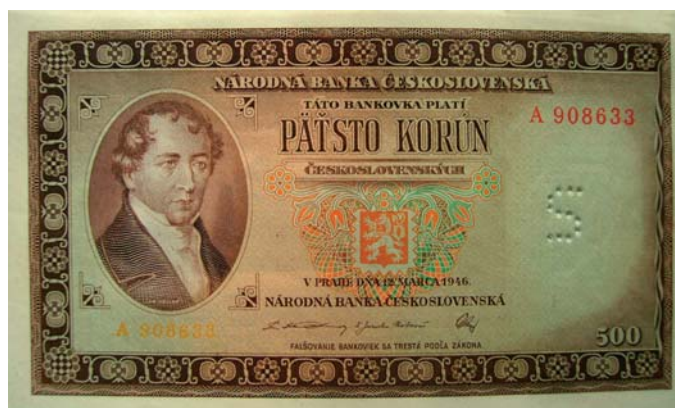
500 korunová bankovka z roku 1946.