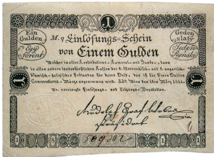
Obr. 6 Schein z r. 1811.

Stále viac sa diskutovalo o tom, či by v peňažnej sústave malo byť kovovým základom namiesto striebra zlato. Toto úsilie vyústilo v roku 1857 do uzavretia zmluvy o zavedení jednotnej striebornej meny, ktorej základom bola vymeniteľnosť bankoviek za striebro. Novou menovou jednot-