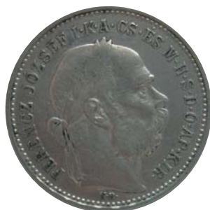
Obr. 1 Koruna z r. 1892 (vznik korunovej meny), uhorský nápis, K. B. – mincovňa Kremnica, averz.

Obidve časti monarchie mali zákonom nariadené stiahnuť z obehu štátovky, pričom tieto boli nahradené v pomere 1 strieborný zlatník = 2 koruny. Prepočítavanie na koruny bolo účinné od