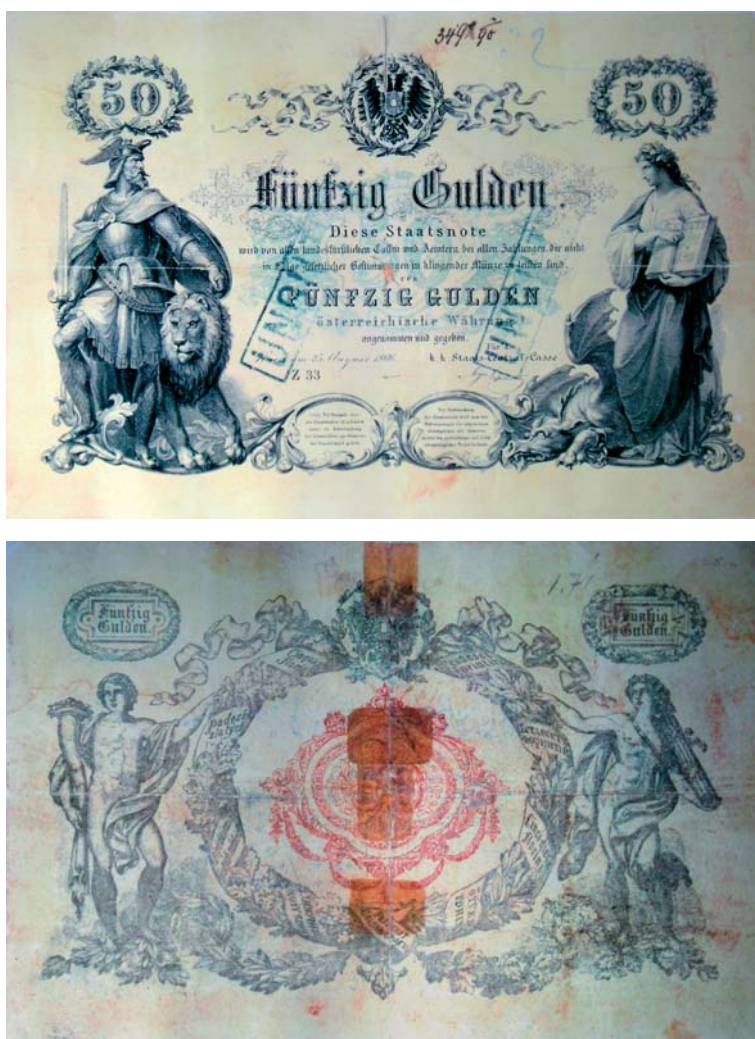
Obr. 8 Päťdesiat zlatých, predná a zadná strana štátovky z roku 1866.

Historicky mimoriadne dôležitým činom Rakúsko-uhorskej banky bolo zavedenie zlatej korunovej meny v roku 1892. Aj keď nebola nikdy uzákonená povinnosť výmeny koruny za zlato, boli zavedené nové predpisy o zdaňovaní bankoviek nad povolený rámec (kontingent) a predpisy o kovovom krytí, pričom po dlhom čase boli vytvorené podmienky na stabilizáciu menových pomerov. Menový vývoj bol vyvážený aj vďaka uplatňovanej devízovej a diskontnej politike, ktorá bola prostriedkom na usmerňovanie