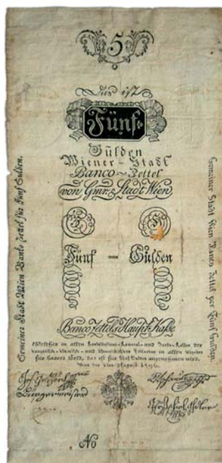
Obr. 4 Päť zlatých z r. 1796, bankocedula.