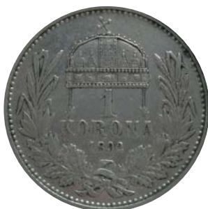
Obr. 1 Koruna s uhorským znakom z r. 1892, reverz.