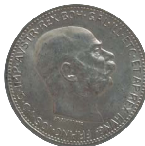
Obr. 2 Koruna z r. 1915, rakúsky nápis, averz.