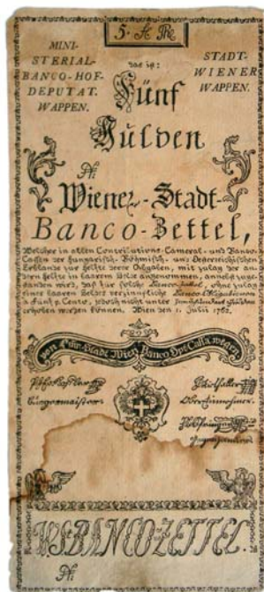
Obr. 3 Päť zlatých z roku 1762, bankocedula, prvý papierový peniaz na našom území.