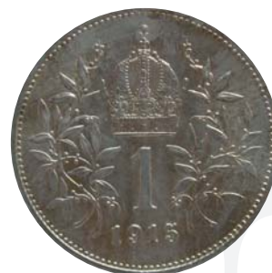
Obr. 2 Koruna s rakúskym znakom z r. 1915, reverz.