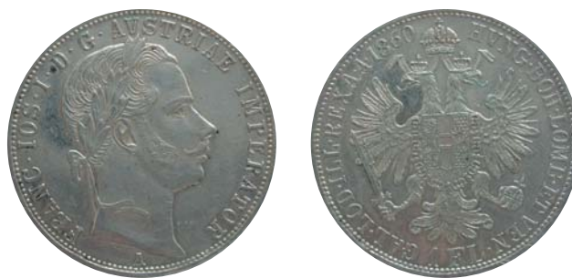
Obr. 7 Jeden zlatník z r. 1860, A – mincovňa Viedeň, averz a reverz.

kou sa stal v roku 1857 už spomínaný strieborný zlatník/gulden/florin (obr. 7).