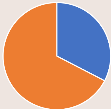
Chránený klientsky majetok FO