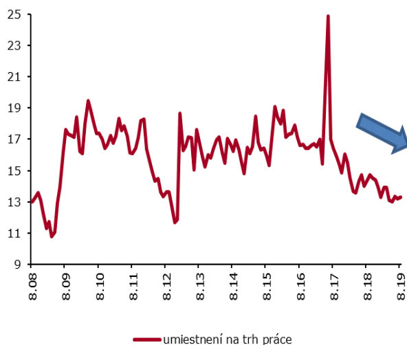
Osoby umiestnené do zamestnania (tis. osôb)

Miera nezamestnanosti z celkového počtu uchádzačov dosiahla v auguste 6,1 %, pričom na tejto úrovni sa nachádza už pol roka (sezónne očistené údaje NBS). Doterajší rast zamestnanosti v tomto roku tak bol saturovaný najmä rastúcou imigráciou a participáciou na pracovnom trhu.